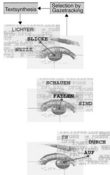
Abbildung 1: General scheme of the Mind-Reading Machine II

decontrolling the process of interaction and shifting it into a denser space of entropy. That is even in terms of information theory an optimally designed communication channel.